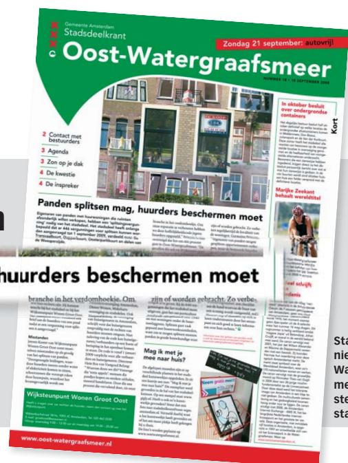
Stadsdeelnieuws Oost-Watergraafsmeer, heldere stellingname stadsdeel

Verhuurder Egelink BV is boos op het Wijksteunpunt in de Baarsjes. Hij wil een aantal woningen samenvoegen en het wijksteunpunt frustrereert dat volgens hem. Terwijl het stadsdeel samenvoegen juist wil stimuleren. Maar wat doet Egelink? Hij schrijft de huurders: "Alle bewoners zullen moeten verhuizen, voor maximaal 20 bewoners is het mogelijk om terug te keren. Er wordt wel een hogere huur vastgesteld." Dat is nou typisch een voorbeeld dat niet meer past in de moderne verhoudingen. De huurder heeft rechten en het is niet langer eenrichtingsverkeer. Dus heeft het wijksteunpunt de huurders uitgenodigd voor een informatieavond en daar is een bewonerscommissie gevormd. Deze onderhandelt nu met de verhuurder, geheel in de geest van de Overlegwet. Maar daar wil de verhuurder niet aan. Hij wil alleen praten met individuele bewoners en niet met de commissie. Nu is hij boos dat het wijksteunpunt haar werk goed doet.